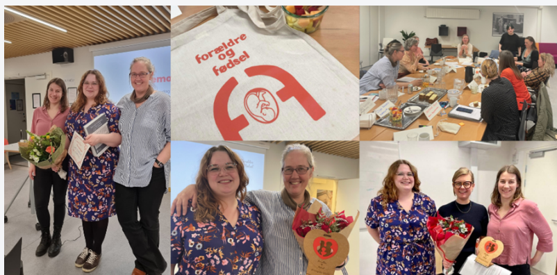
Fotos: Deltagere på Forældre og Fødsels generalforsamling